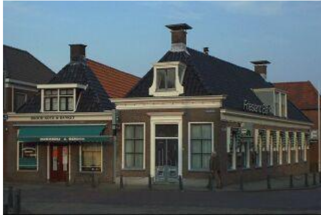
Nieuwburen 2 en 4