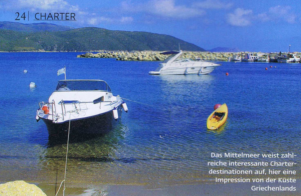
Das Mittelmeer weist zahlreiche interessante Charterdestinationen auf, hier eine Impression von der Küste Griechenlands