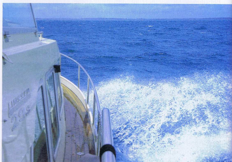
Für Ostseetörns ist der amtliche Sportbootführerschein See Pflicht

Bereits 1961 begannen Henk und Alie Stekelenburg mit dem Bau, Verkauf und Vermietung von Ruderbooten. Mittlerweile werden auf dem Firmengelände im Örtchen Langelille nach eigenen Entwürfen luxuriöse Motoryachten für das Chartergeschäft und den Verkauf gebaut. Im Jahr 2011 begeht man mit zahlreichen Festlichkeiten das 50-jährige Firmenjubiläum. Seit 15 Jahren werden die Geschäfte von Sohn Daan und Tochter Els geführt. Auf dem Gelände mit eigenem Hafen und 50-ton-Lift können sämtliche Arbeiten an Yachten ausgeführt werden. Ein Zubehör- und Angelshop sowie ein Supermarkt erleichtern die Versorgung. Alle Kunden sind herzlich eingeladen, am Firmenjubiläum teilzunehmen. Weitere Infos: www.driespong.net